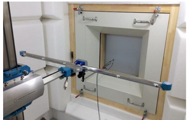
図 3 ランダム入射音響透過損失測定の様子