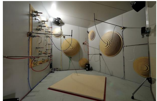
図 2 残響室法吸音率測定時の装置構成