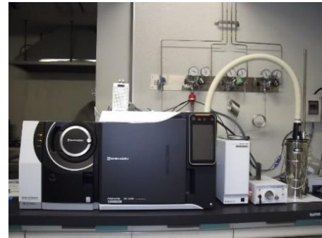
図 1 熱分解ガスクロマトグラフ質量分析計

本機器はガス成分を分離し、分析するために用います(表 1, 図 1)。分離したガスの質量情報を取得し、その質量スペクトルから成分の組成が推定できます。気体の分析のほか、加熱により気化する成分を含む液体や加熱・熱分解によりガスを発生する樹脂などの固体の分析が可能です(図 2)。本機器は、樹脂材料をはじめ、異物や各種有機材料の比較・分析などにご活用いただけます。分析をご検討の際はお気軽にご相談ください。