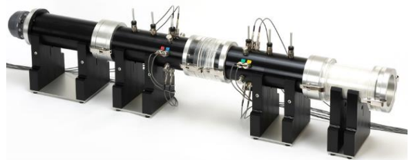
図 5 垂直入射音響透過損失測定時の装置構成