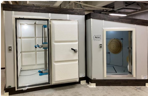
図 1 吸音率・音響透過損失測定装置

本装置や防音性能評価に関する技術相談がございましたら、お気軽にお問合せください。