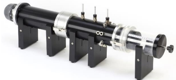
図 4 垂直入射吸音率測定時の装置構成