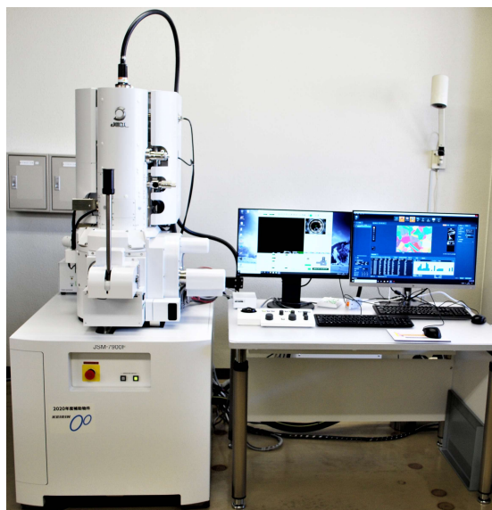
EBSD搭載走査電子顕微鏡

金属材料の強度不足や破損などの不具合の解明において、結晶配向の変化や加工によって生じる歪み分布の状態を把握することは極めて重要です。「EBSDで何が分かるか」、「製品開発や故障解析にどう役立つか」という視点から、技術者・研究者の方を対象に、事例を交えて具体的に解説します。